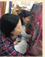
付出更多的心力，只為了帶給大家更豐富的體驗。

然而除了在縣內數一數二的優秀的軟硬體之外，每一天，我們還仰賴著一群陣容堅強的志工爸爸媽媽，因為有他們不間斷的自動服務，圖書館才能正常的運轉。自從擔任東興國小的閱讀教師以來，我才真正了解一個圖書館的運作是如此繁瑣，從書籍編碼、書籍借閱與歸還、書籍的上架與管理，所有的細節都有非常多的學問，這樣看似平常的日常，卻是圖書館是否可以正常運作的基石。如果你有機會和志工爸爸和媽媽談上天，你就會發現，志工爸爸媽媽們總是體貼地替大家著想，永遠為照顧同學們的權益而努力著。親愛的小朋友們，當你看到書架上整齊的書籍，你曾想過這需要多少人的努力，才可以順利的提供借閱？