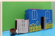
201 李沛璇、沈秀柔 漂：亮：的：木：頭：房：子 繽紛：盆：栽 + 運：河 荷：蘭：船：屋