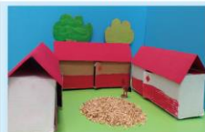
201 范廷加、許至皓 ㄇ 字：型：平：房 紅：色：屋：瓦 + 大：大：的：庭：院 美：麗：的：三：合：院