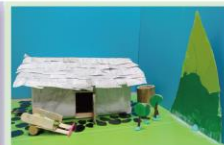
201 顏以帆、梁碩庭 山：樹 + 數：不：清：的：石：板 大：自：然：中：的：石：板：屋