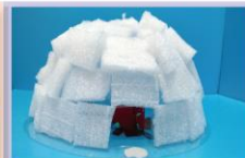
201 吳浩為、彭心妍 葉：沛：學 白：帽：子 + 門 愛：斯：基：摩：人：的：冰：屋